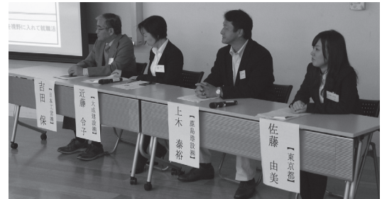
第1部 OBによるパネルディスカッション