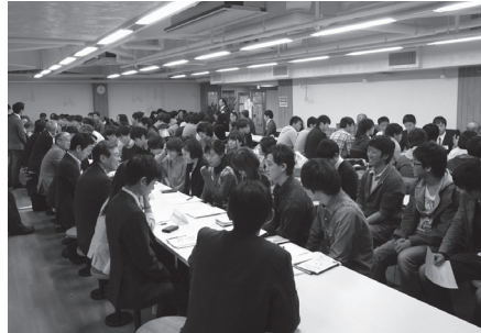
第2部 業種別意見交換会