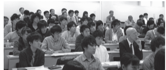
第1部 OBによるパネルディスカッション (講聴風景)