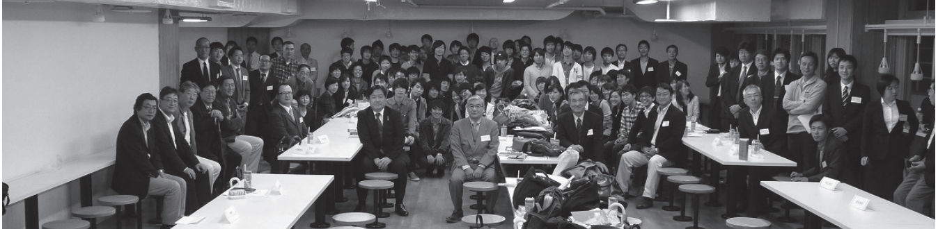
第2部 業種別意見交換会