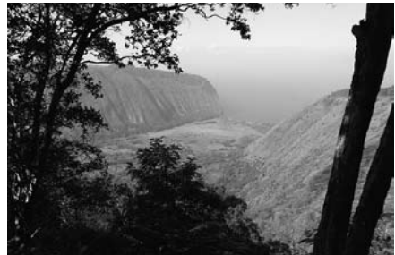
写真 Waipio渓谷を山側より見下ろした写真