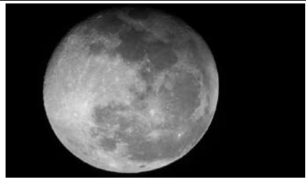
写真2 Mauna Kea (4,205m) 頂上近辺で撮影した月の表面

ビ付レンタカーで19号線を北部に向かって走り、道なりに走ると北部右岸に出る。240号線と合流すると240号線に入り北上するとワイピオ渓谷に到達する。あたり一面は緑豊かな渓谷があり、ワイピオ・ベイに行くためには急勾配の坂を下るため4輪駆動車で行かないといけない場所でもある。渓谷に入ると草木の茂る世界となる。渓谷に入らなければ緑豊かな山々が連なる世界となっており、乗馬ツアーを楽しみながら野山を歩くことが出来る。ここは、岩場ばかりのハワイ島という印象を完全に払しょくしてくれる世界である。写真3は乗馬ツアーに参加し、山側よりワイピオ渓谷を映した写真である。なお、無愛想なナビであったが、大いに役立ったことを付記しておきます。