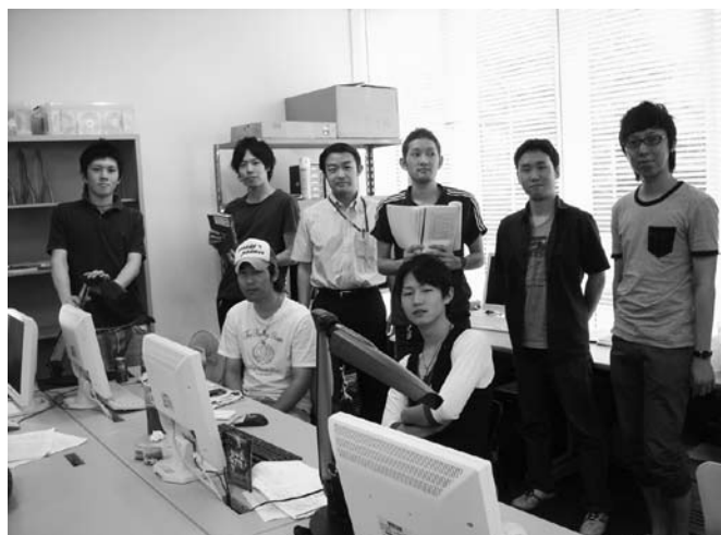
水文気象環境研究室のメンバー（フォーキャスト市ヶ谷にて）

以上、簡単に当研究室の状況を紹介させていただきましたが、今後も「地球環境問題や気象災害に立ち向かう水文気象環境研究室」として、環境問題の解決や気象災害の軽減に少しでも貢献できるよう精力的な活動を行っていきたく考えております。本学科のように、同窓会組織がしっかりしていて、活発な活動がなされていることは、教員として非常に心強いことでもあります。まだまだ至らぬ所の多い新任教員ではございますが、OB・OGの皆さまのお力添えをどうぞ宜しくお願い申し上げます。