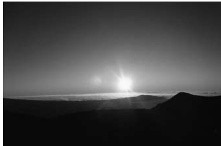
写真1 Mauna Kea (4,205m) 山頂からの沈みゆく夕日

今回のハワイ島滞在で初めて、岩場の無い緑豊かな土地があることを知りました。その場所はWaipio Valleyです。Waikoloaより車で約1時間の場所である。無愛想なナ